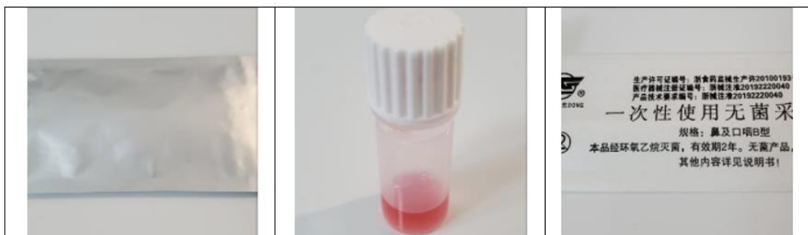
新型コロナウイルス検査カード